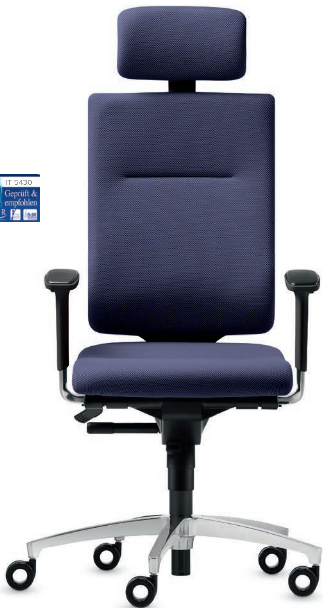
SD IT 5430 + Armlehnen | Armrests A204APO