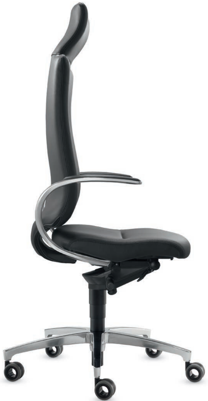
SD IT 5450 + Armlehnen | Armrests AS14APO