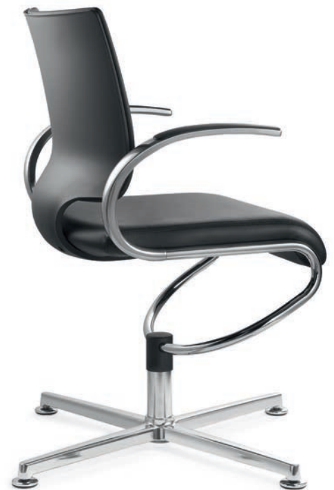
IT 5409 Armauflagen (PU) | Armpads (PU) AA03KGS