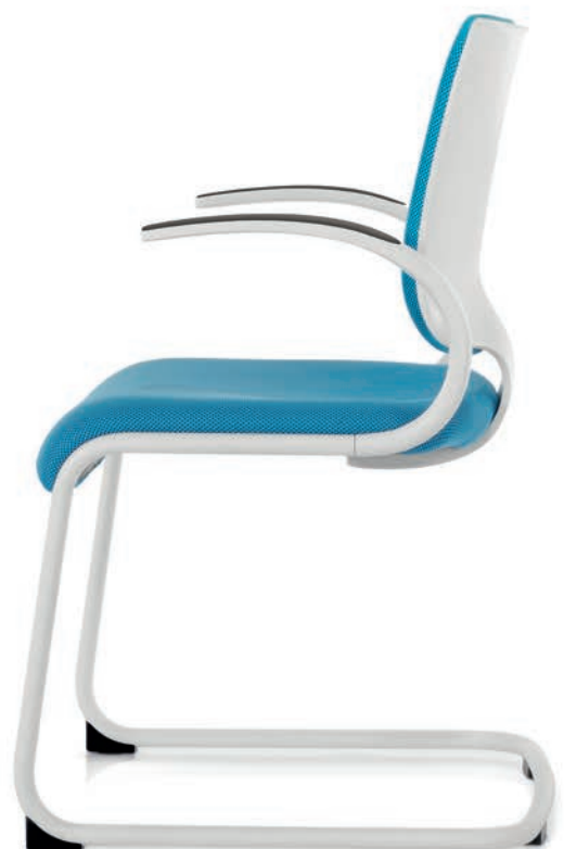
IT 5405 Armauflagen (PU) | Armpads (PU) AA03KGS