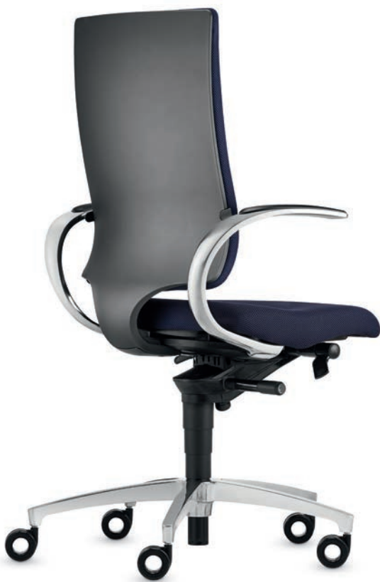
SD IT 5410 + Armlehnen | Armrests AS13APO