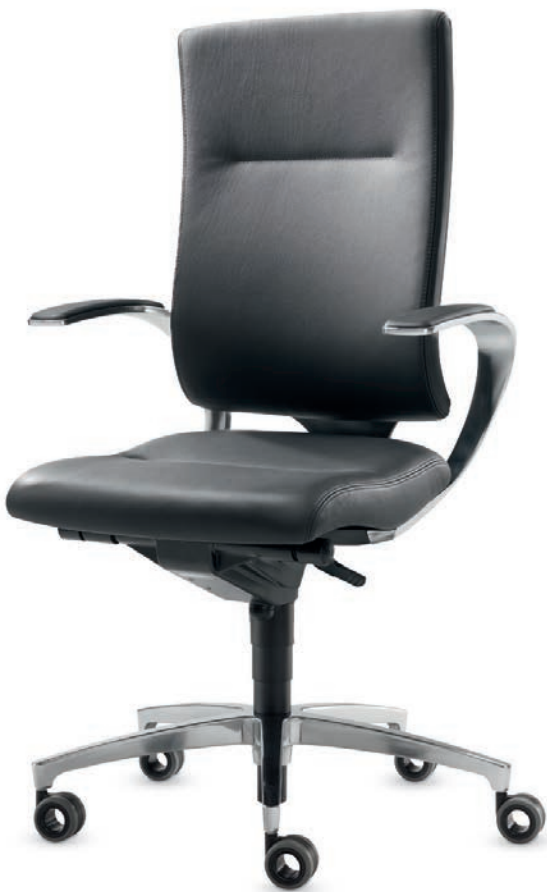
SD IT 5440 + Armlehnen | Armrests AS14APO