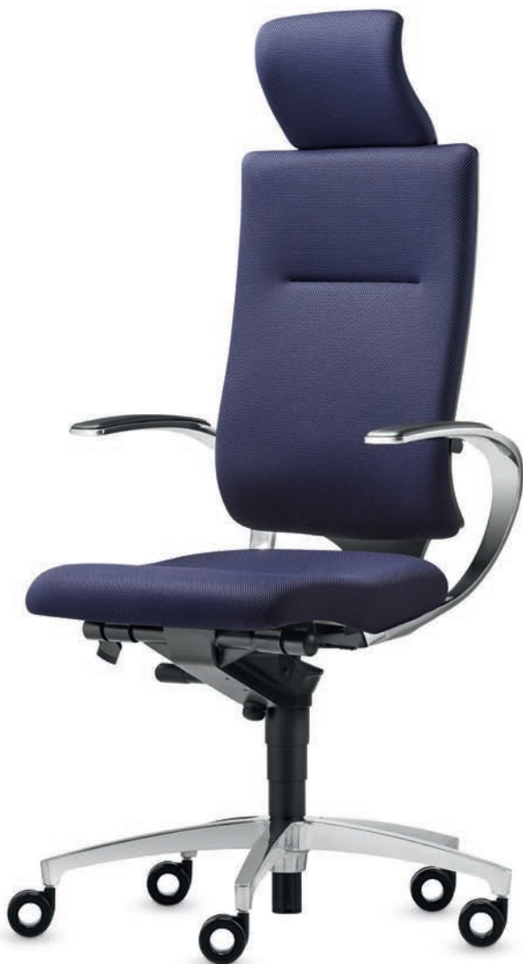
SD IT 5420 + Armlehnen | Armrests AS13APO

A classic through and through. As a design scheme, “black” is classically beautiful – and never fails to excite. Concentrating on what is essential focuses attention on form and functions. The chair exudes presence, yet allows ample scope for creativity. With their bold design, the loop armrests are not only comfortable but also emphasise the InTouch swivel chairs’ organic lines. The conference chairs carry on the fine line set by the office swivel chair.