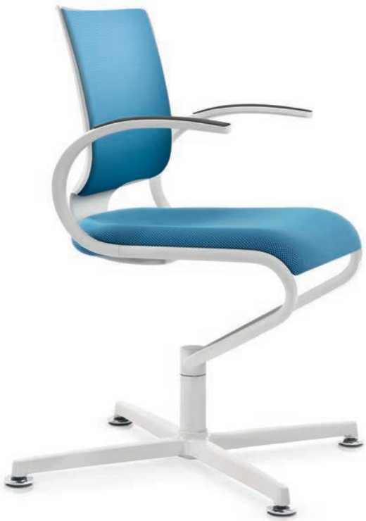
IT 5409 Armauflagen (PU) | Armpads (PU) AA03KGS

InTouch follows the movements of its user with its three-piece seat shell and backrest which is modelled on the shape of the body, and thus ensures perfect harmony for the person sitting on it. With a sleek organic design, the elastic and flexible Dauphin seat system supports the entire posture and locomotor system at all times in direct contact with the body. The white edition exudes fresh elegance and brings every detail of the dynamic design to the fore.