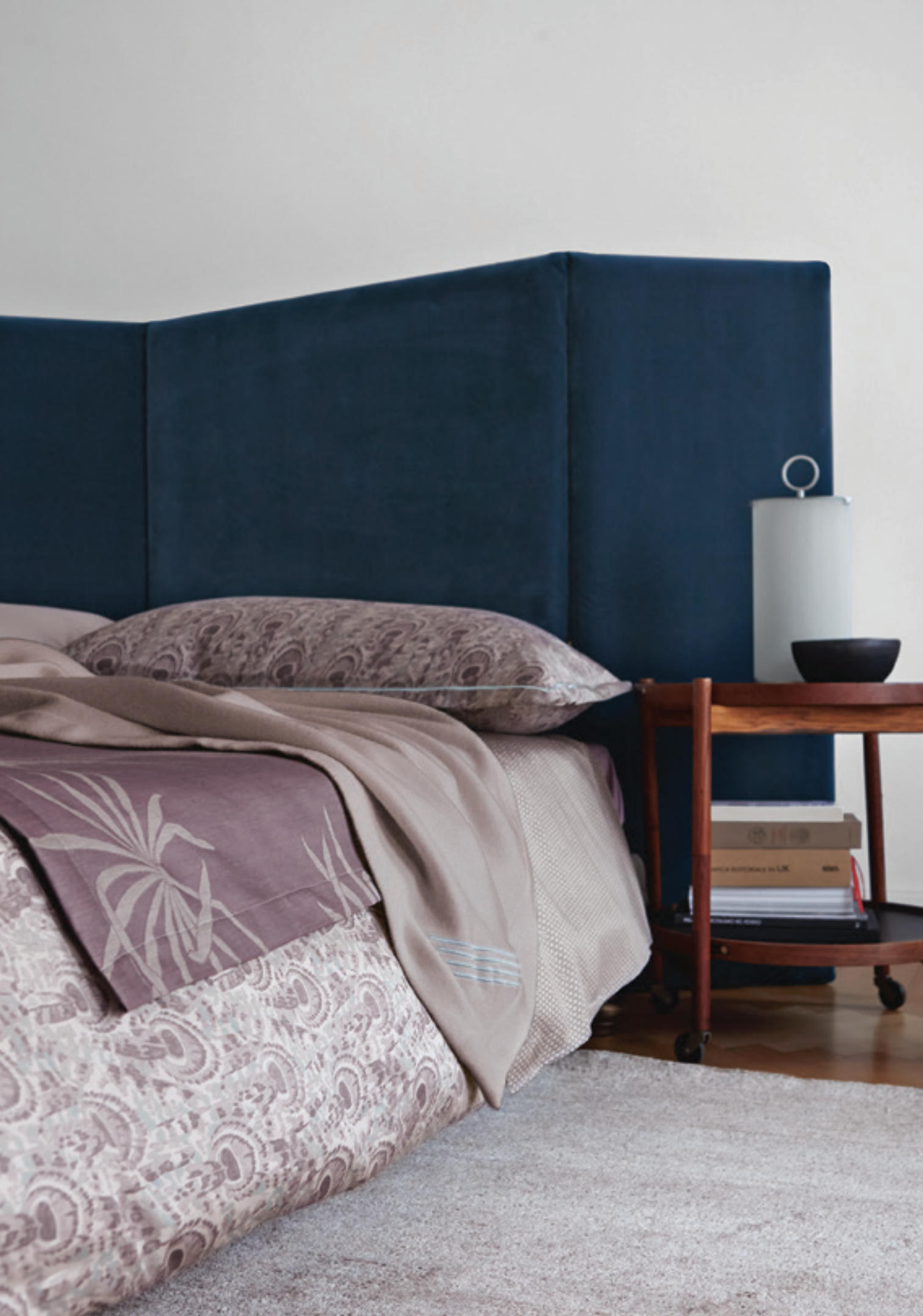
PEACOCK: federa decorativa in raso di cotone stampato / printed sateen sham TANGIER: federa decorativa in fiandra tinto in filo / yarn-dyed sateen sham.