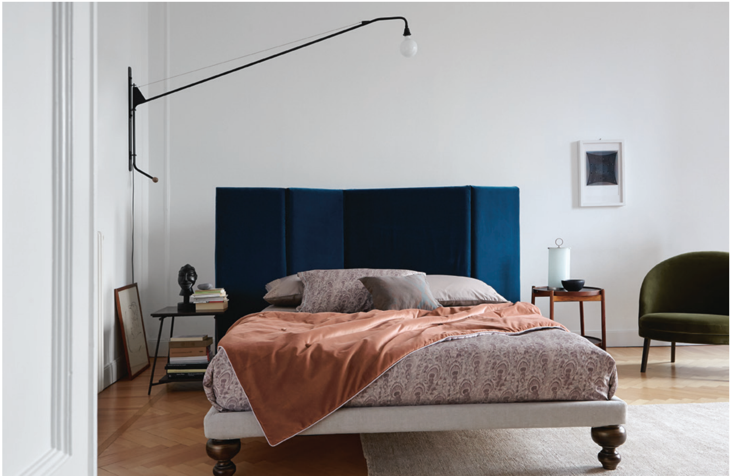
PEACOCK: copripiumino e federe in raso stampato / printed sateen duvet-cover and sham ONDINE: federe in raso con pizzo / sateen shams with lace TANGIER: federa decorativa in fiandra tinto in filo / yarn-dyed sateen sham VELOUR: plaid imbottito in velluto e raso unito / padded velvet and sateen throw.