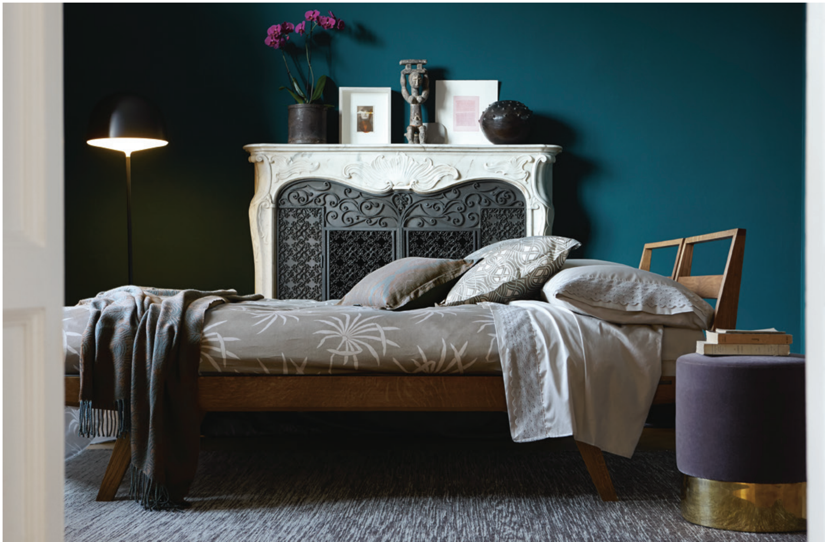
PALM: copripiumino in raso stampato / printed sateen duvet-cover ONDINE: lenzuolo e federe in raso con pizzo / sateen sheet and shams with lace DECÒ: plaid jacquard in merino extra fine / extrafine merino jacquard throw DECÒ: federa decorativa stampata / printed sham TANGIER: federa decorativa in fiandra tinto in filo / jacquard sateen sham.