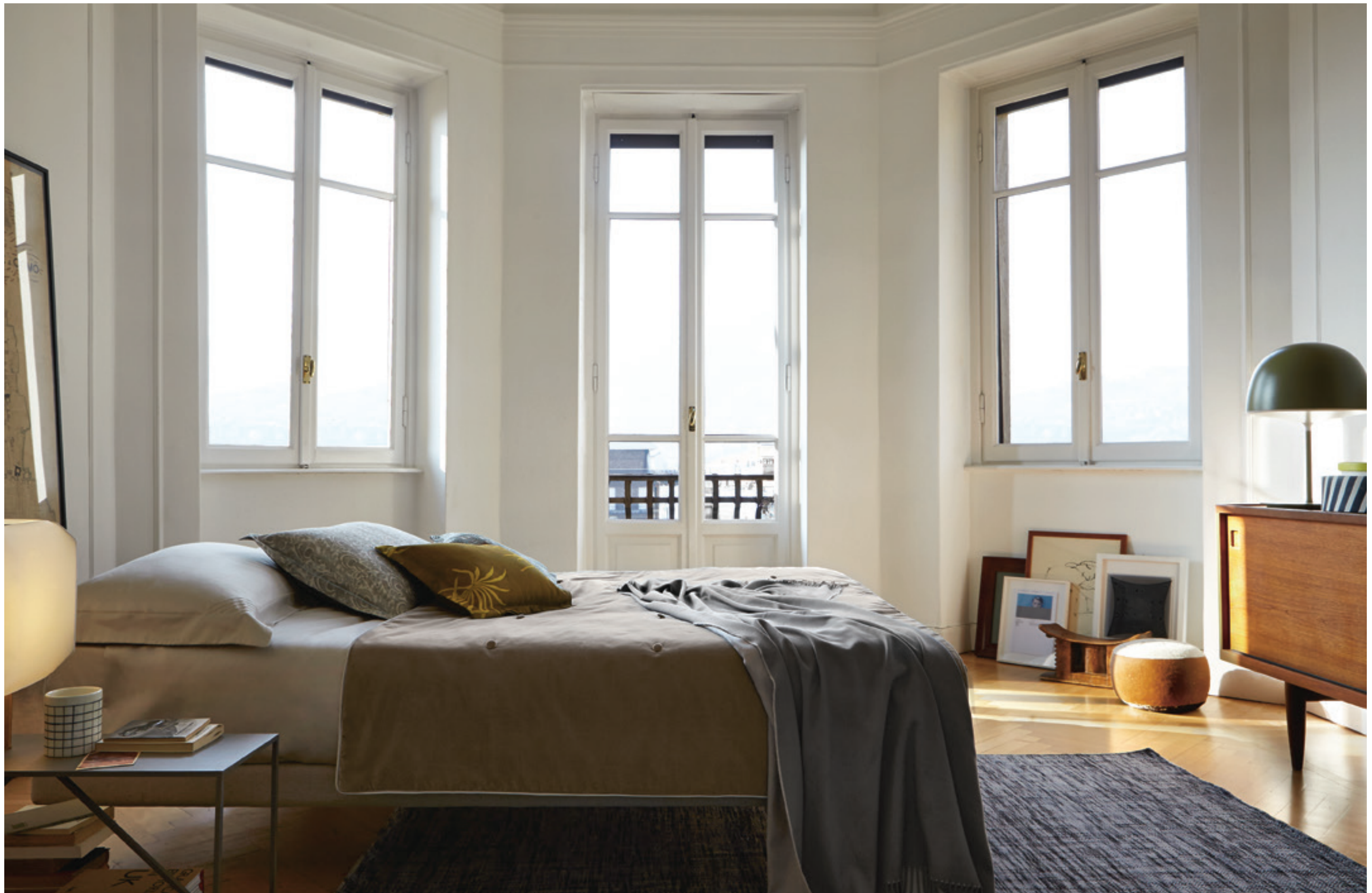
STITCH: lenzuolo e federe ricamate a capo / embroidered sheet and shams PALM: federa decorativa in matelassé jacquard / matelassé jacquard coverlet sham VELOUR: plaid imbottito in velluto e raso tinta unita / padded velvet and sateen throw PEACOCK: federa in raso stampato / printed sateen sham LEIDA: plaid in cashmere, seta e lana / cashmere/silk/wool throw.