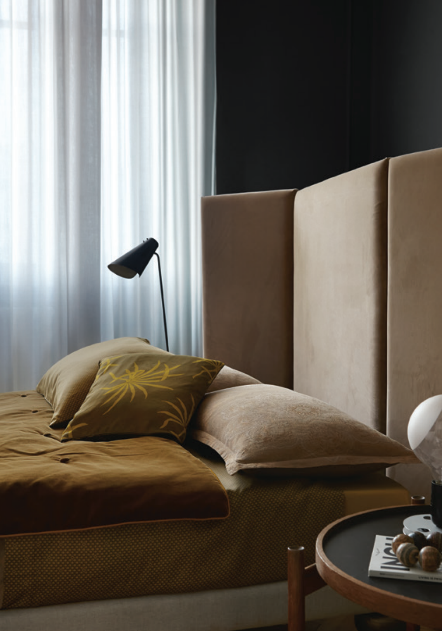
TANGIER: federa decorativa in fiandra tinto in filo / yarn-dyed sateen sham TIE: dettaglio lenzuolo in raso stampato / printed sheet (detail).