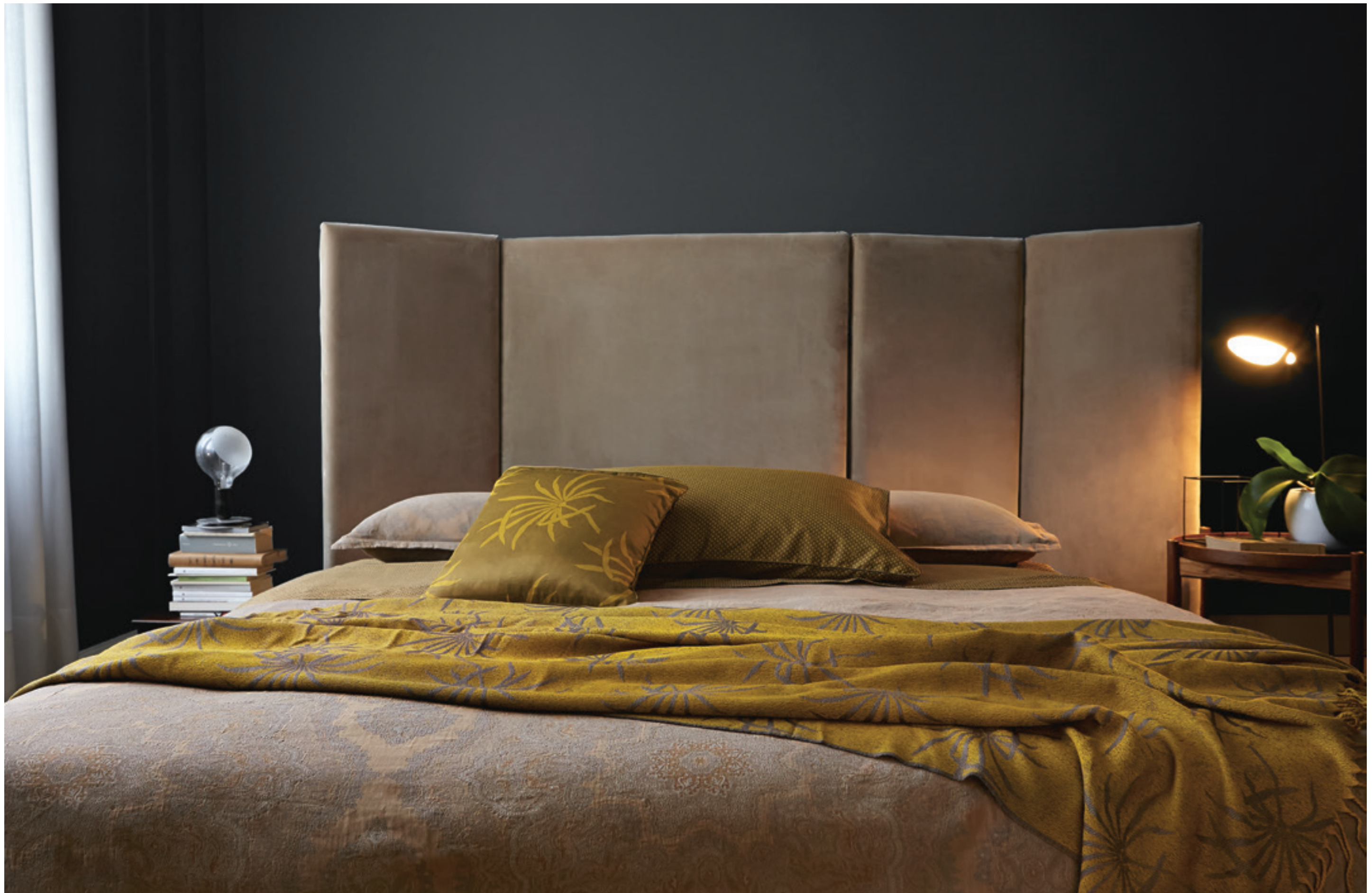
TANGIER: copripiumino e federe in fiandra tinto in filo / yarn-dyed sateen duvet-cover and shams PALM: federa decorativa in matelassè jacquard / matelassé jacquard sham TIE: federa in raso stampato PALM: plaid jacquard in merino extra fine / extrafine merino jacquard throw.