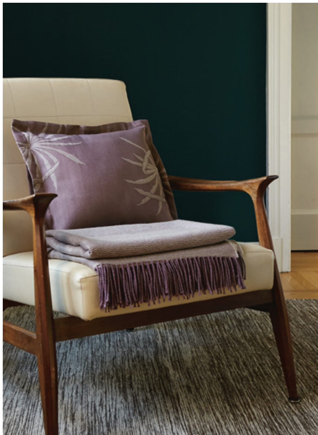
PALM: federa decorativa in matelassé jacquard / matelassé jacquard sham FLAPPER: plaid jacquard in merino extra fine / extrafine merino jacquard throw.